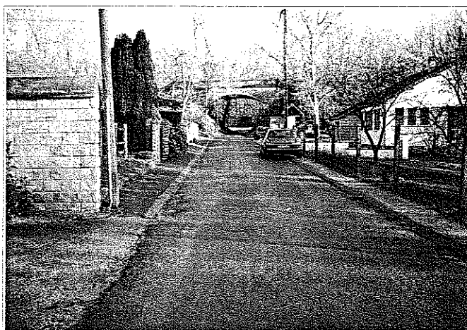
Le Chemin du Vivier - Commune d'Haramont

Secteur vallée de l'Automne et de ses affluents